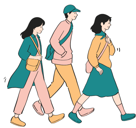
mers pe jos la școală în ritm rapid

Activitate fizică moderată: îți bate inima mai repede dar poți vorbi sau cânta.