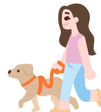
plimbat câinele în ritm rapid

Activitate fizică intensă: crește frecvența respirațiilor, vorbești greu în timpul ei.